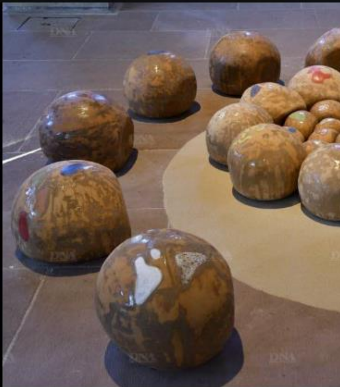
L'installation de Gisèle Lambla.

Les étudiants de l'Institut européen des arts céramiques achèvent actuellement leur année de formation professionnelle à Guebwiller. Les travaux qu'ils ont soumis au jury national pour l'obtention du diplôme de créateur en arts céramiques sont exposés dans la nef des Dominicains.