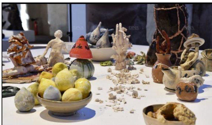
Aucune tristesse dans la céramique d'Éléonore Descazals !